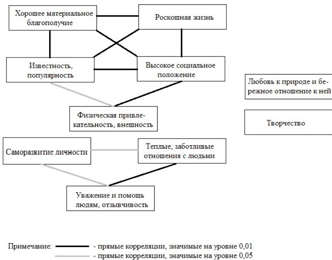
Рис. 3. Взаимосвязи между значимостью различных ценностей у студентов-волонтеров