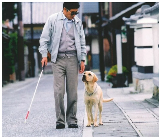
Рис. 3. Человек со зрительным расстройством и собакой-поводырем