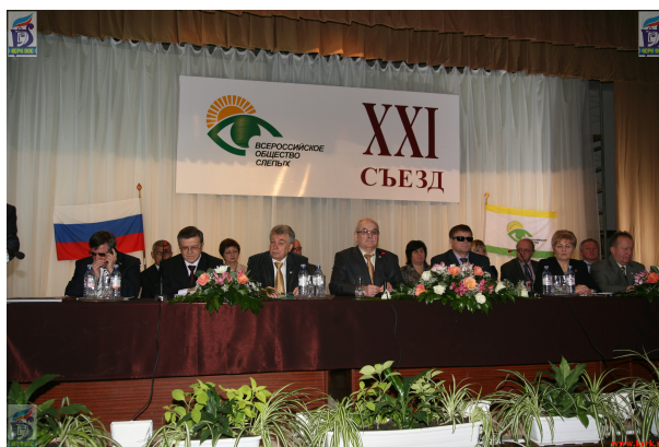
Рис. 2. Всероссийское общество слепых