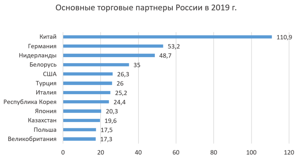
Рис. 2. Основные торговые партнёры России в 2019 г. по товарообороту, млрд. долл. Источник: составлено автором на основе данных портала Федеральной таможенной службы РФ. URL: http://customs.ru/folder/511 (Дата обращения: 10.10.2020).