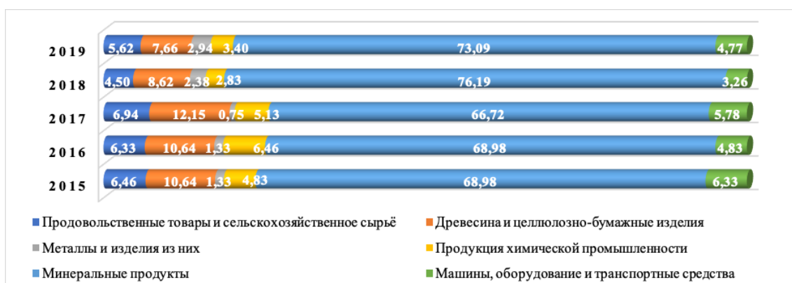
Рис. 2. Основные доли структуры экспорт России и Китая в период 2015-2019 гг. Источник: составлено автором на основании данных портала Внешней торговли России. URL: https://russian-trade.com (дата обращения: 02.02.2020)