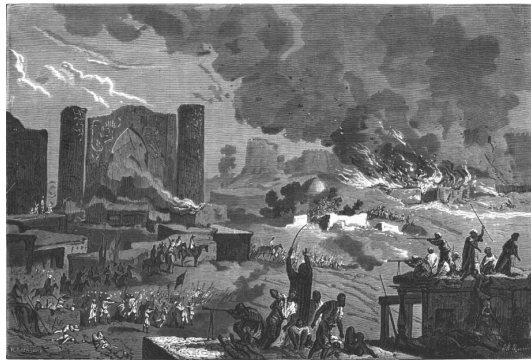
Защита Самаркандской цитадели. Рис. Н. Каразин, грав. Н. Колчанов.