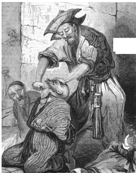
Рис. 4. Н.Н. Каразин. Казнь преступника в Бухаре. Всемирная иллюстрация. 1872. № 7