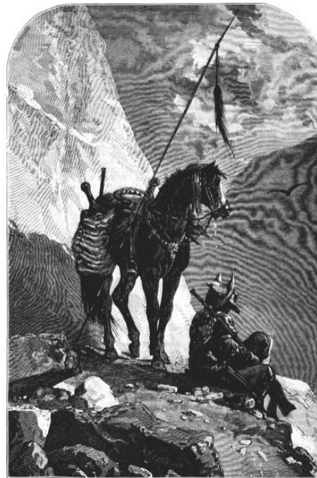
Защитники Заревшанских горъ. I. На стражѣ. Изъ путевыхъ альбомовъ Н. Каразина, рисов. самъ авторомъ, гравиров. Заболоцкий.