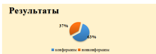
Рис. 2. 2-изображения