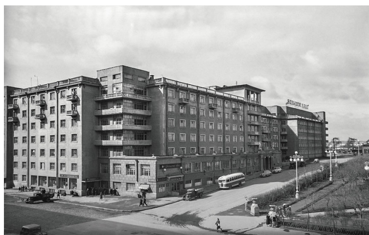
Рис. 3. Илл. 3 Фото гостиницы Большой Урал в процессе реконструкции, весна 1940 года.