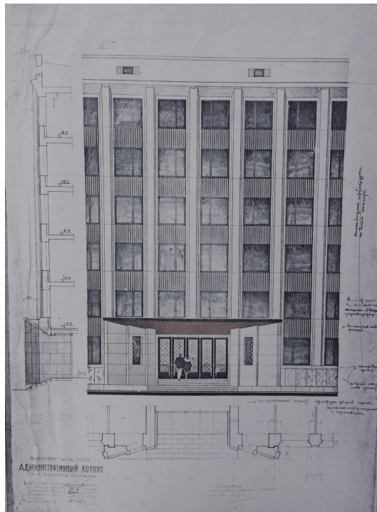
Рис. 7. Илл. 7 Чертаж главного фасада Войсковой части 77130. Административный корпус по ул. Восточной. Публикуется впервые