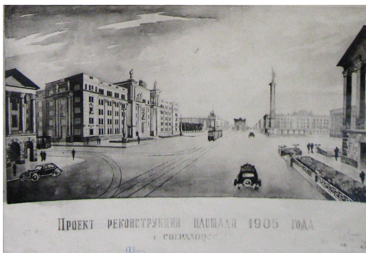
Рис. 4. Илл. 4 Проект реконструкции площади 1905 года г. Свердловск 1944 год.