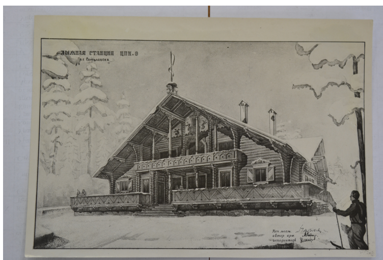
Рис. 6. Илл. 6 Проект лыжной станции ЦПКиО г. Свердловска, рисунок 1939 года с подписью архитектора. Архив Музея архитектуры и дизайна(Екатеринбург), фонд архитектора. Публикуется впервые