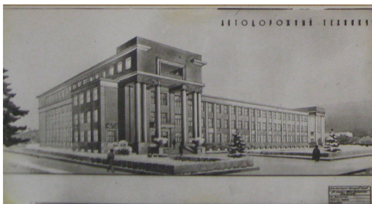
Рис. 5. Илл. 5 Проект Автодорожного техникума г. Свердловска, рисунок 1936 года с подписью архитектора. Публикуется впервые