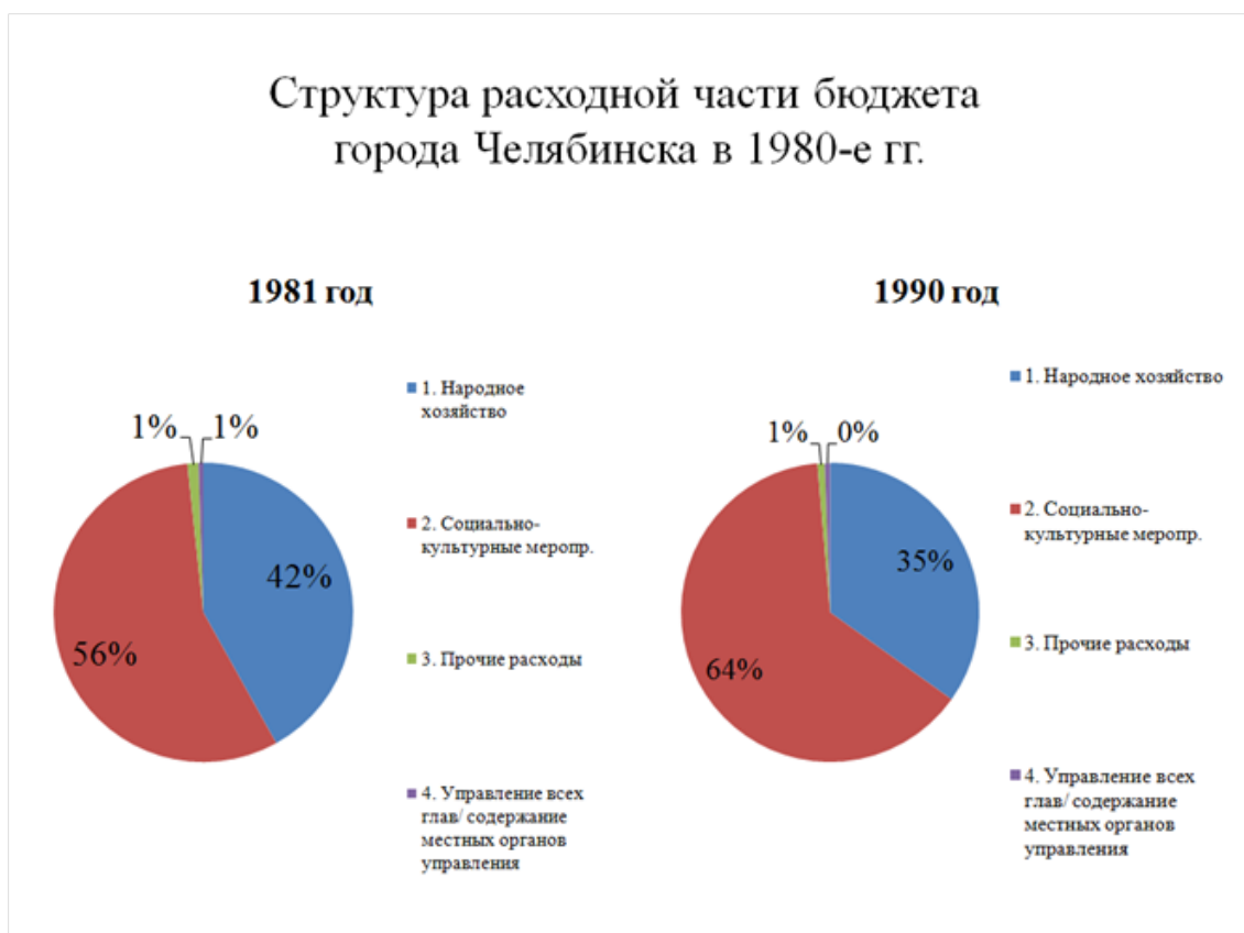
Рис. 3. Структура расходной части бюджета города Челябинска в 1980-е гг.