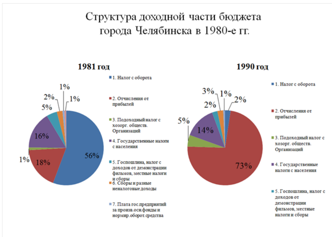
Рис. 2. Структура доходной части бюджета города Челябинска в 1980-е гг.