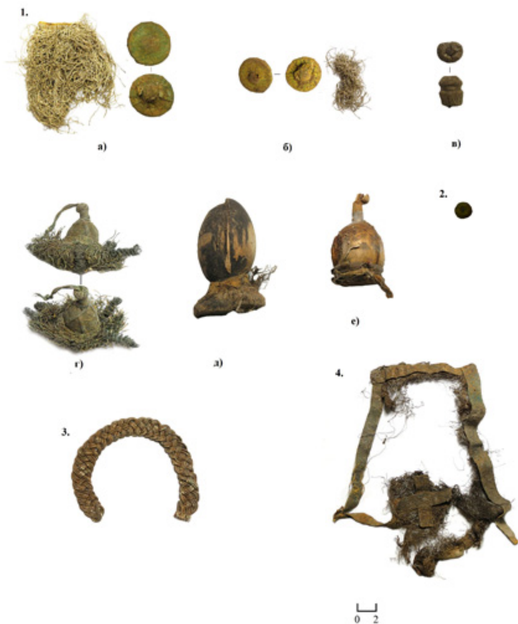
Рис. 3. Фрагменты завес и церковного облачения.