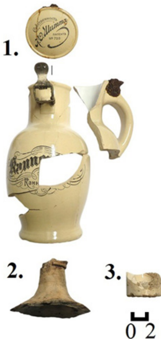
Рис. 1. Фрагменты тарной посуды.