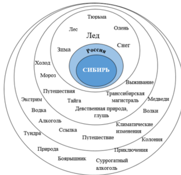
Рис. 2. Полевая структура концепта "Сибирь"