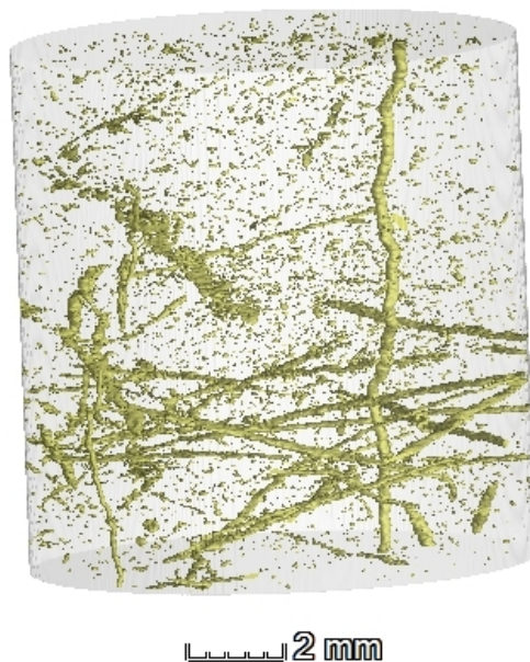
Рис. 2: Трехмерная реконструкция образца юрской глины (гл. 48,0-48,4 м). Желтым цветом показаны ходы илоедов, заполненные пиритом (16-кратное увеличение)