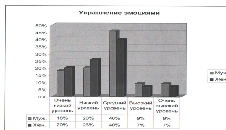
Рис. 2: Рис. 2