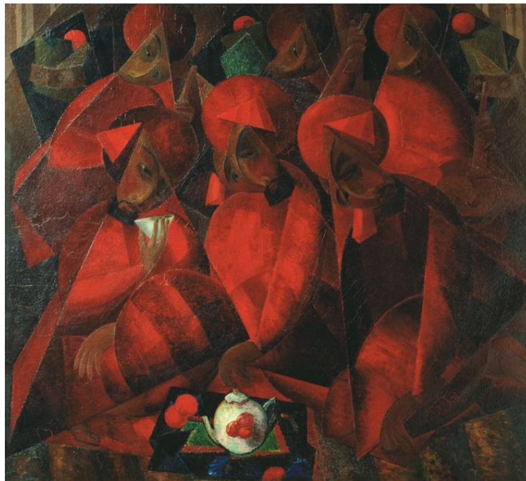
Рис. 1: А.Н. Волков. Гранатовая чайхана. Х., м. 1924 г. Государственная Третьяковская галерея, Москва