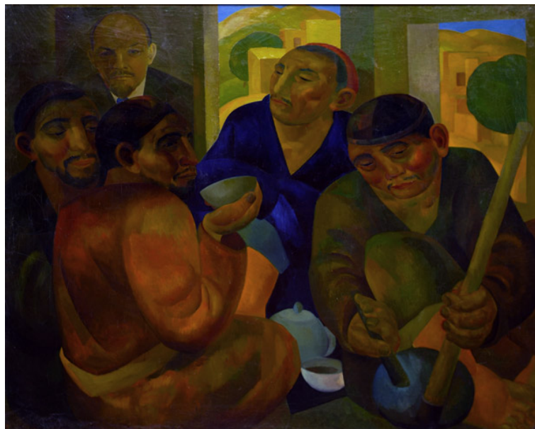
Рис. 2: А.Н. Волков. В чайхане. Х., м. 1928 г. Музей изобразительных искусств им. И.В. Савицкого, Нукус