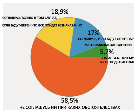
Рис. 3: Распределение ответов на вопрос "Как Вы поступите, если Вам представится возможность заработать путем незаконного оборота ресурсов окружающей среды?"