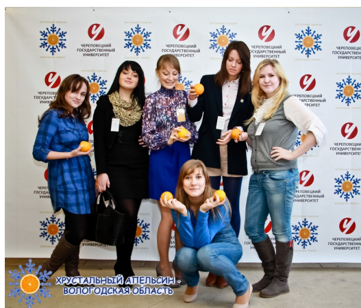
Рис. 3: Проведение Хрустального апельсина - Вологодская область 2011