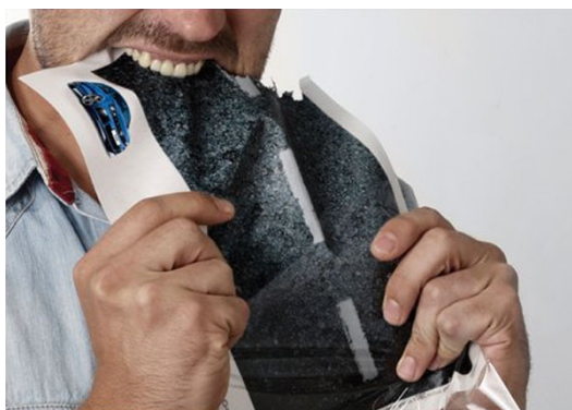
Рис. 1: реклама Volkswagen Golf R