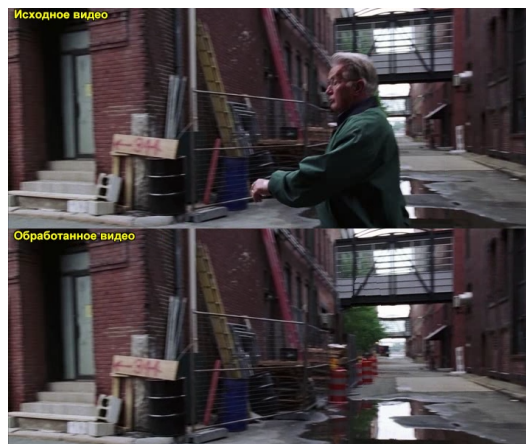
Рис. 3: Пример работы алгоритма удаления объектов