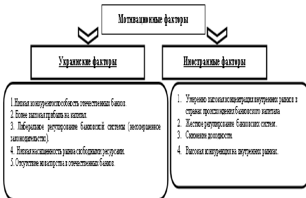
Рис. 1: Рис.1. Мотивационные факторы вхождения иностранных инвесторов