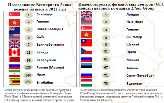
Рис. 1: Москва в мировых финансовых рейтингах